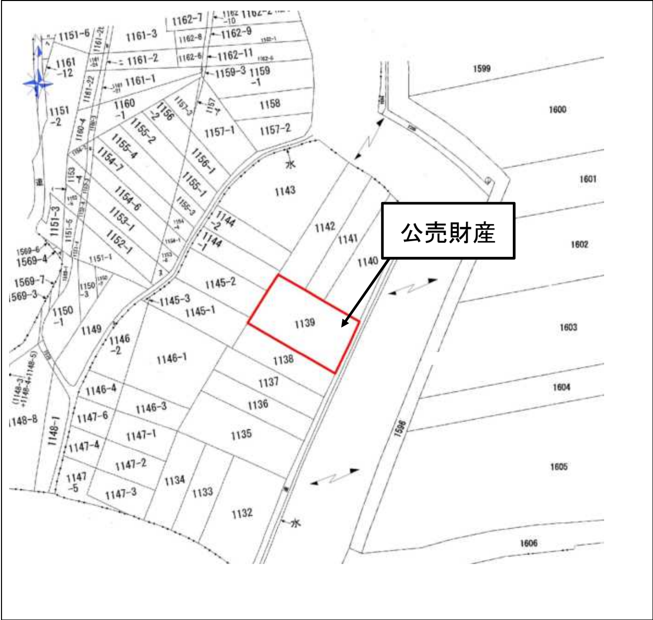
土地参考図(公図集合)